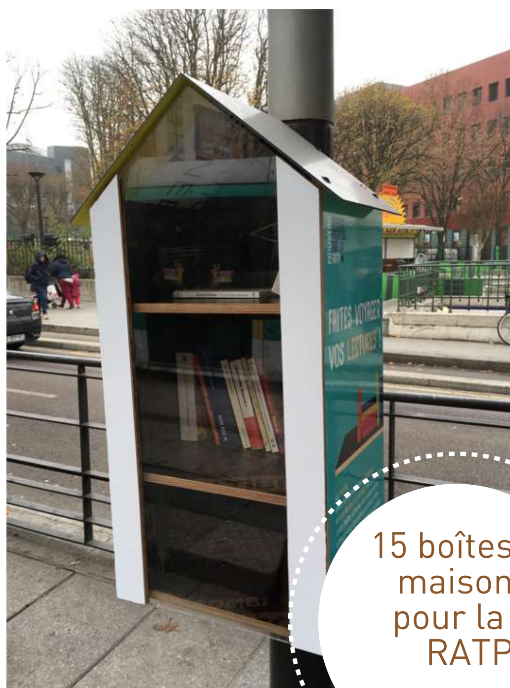
15 boîtes maison pour la RATP