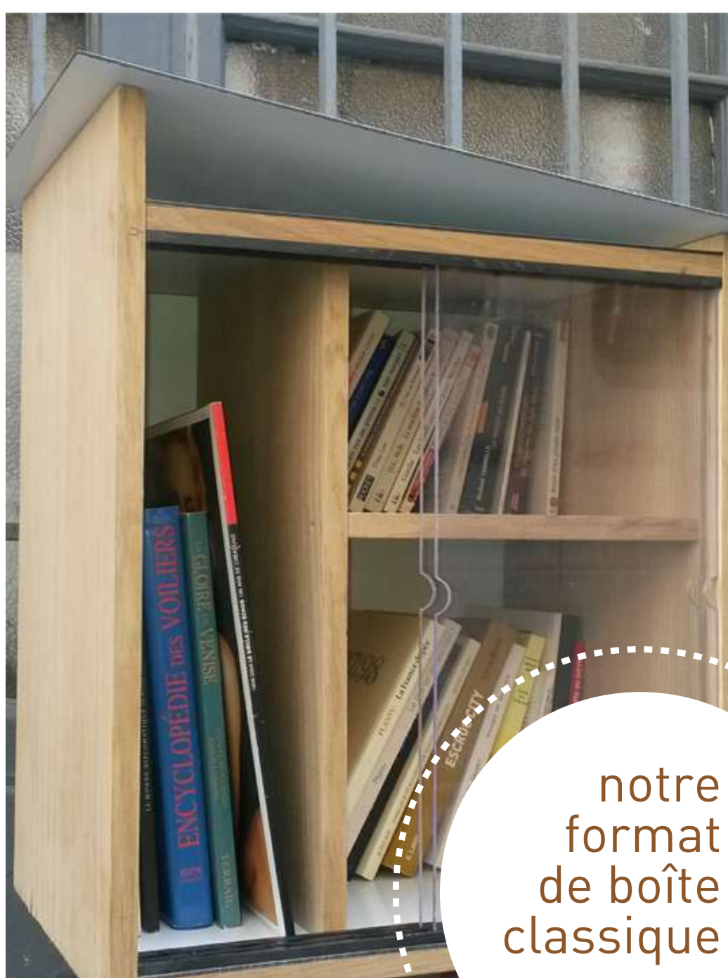
notre format de boîte classique