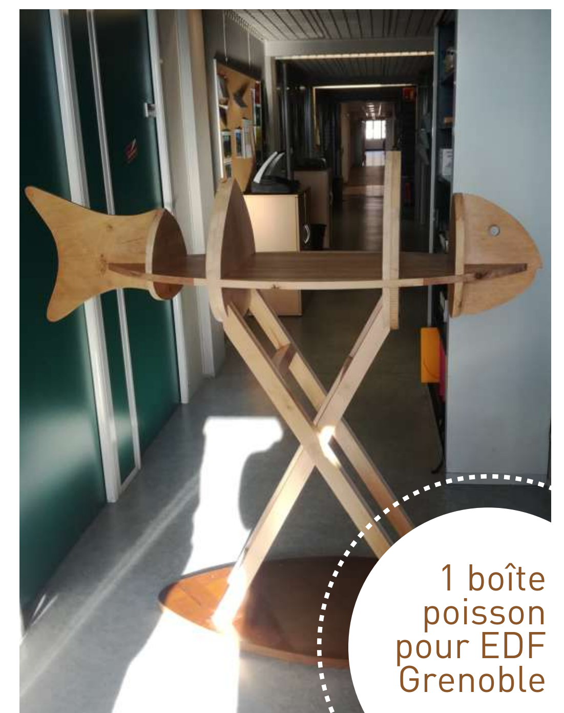
1 boîte poisson pour EDF Grenoble

Nos boîtes à lire sont fabriquées avec 90% de matériaux réutilisés : Un panneau de coffrage (destiné à faire des coffrages dans le BTP), un dibon (plaque de 3 mm d'épaisseur composée d'aluminium et de résine) et du bois récupéré sur des meubles destinés à la benne. Nous y ajoutons du plexiglas, des charnières et des vis pour rendre les boîtes résistantes aux intempéries.